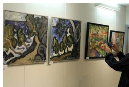
Exposition «Les imagiers provençaux»