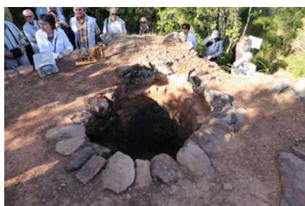
Visite commentée du four à cade des pousselons