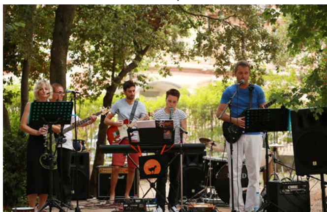
Groupe «Cat's Roll»