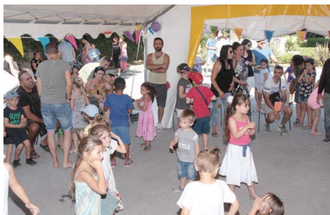
Boum pour les enfants