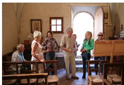
Visite de la chapelle Saint-Jacques