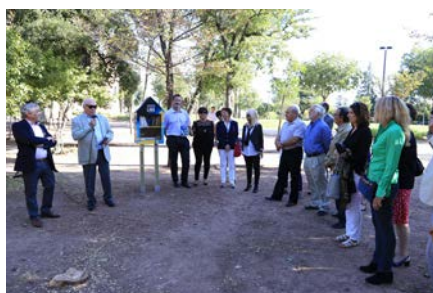
Inauguration des boîtes à livres