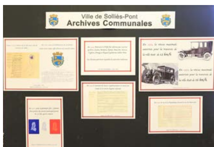
Exposition d'archives communales