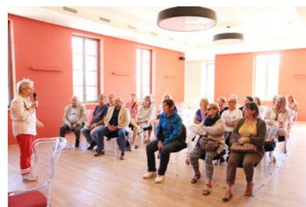
Visite commentée du château