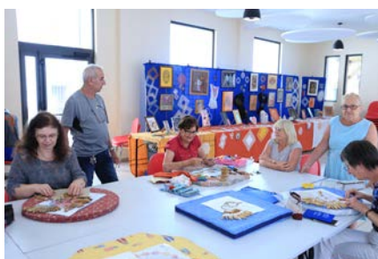
Exposition par l'association des dentelières