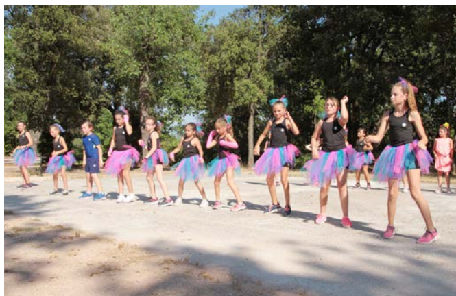
Démonstrations de danses par «Bailo Latina Interface»