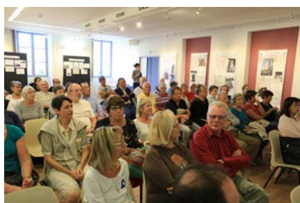
Conférence «L'art campanaire»