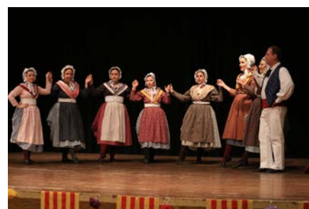
Spectacle du groupe Leï Ginesto