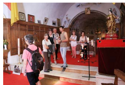
Visite de la chapelle Sainte-Christine