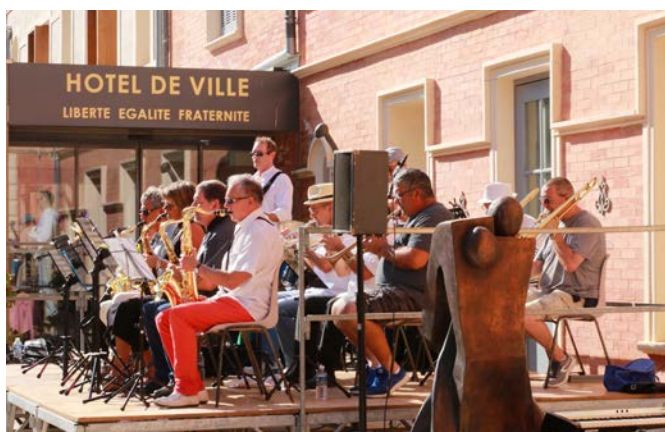
Concert de l'école de musique