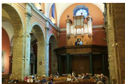
Audition «promenade de l'orgue Callinet»