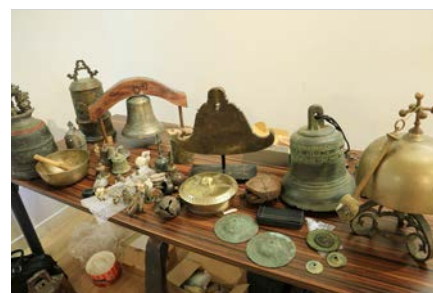
Exposition «L'art campanaire dans la vallée du Gapeau»