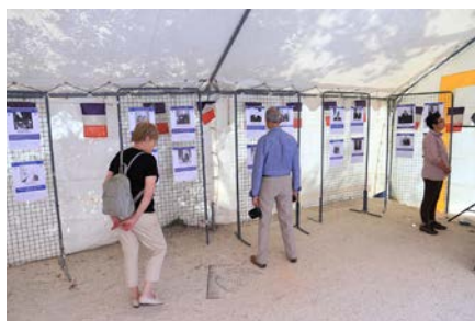
Exposition des Présidents de la République Française