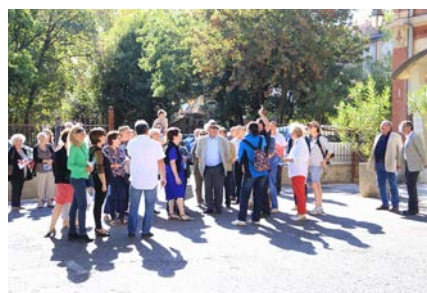
Balade botanique guidée