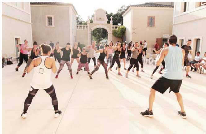
Démonstrations de Sh'bam et de Body Combat