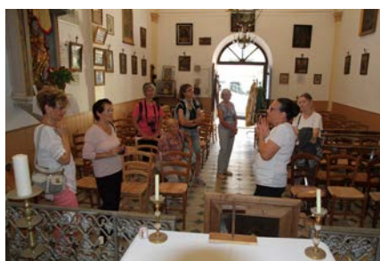
Visite de la chapelle Saint-Roch