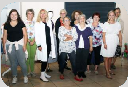
Le costume provençal par l'association "Leï Ginesto"