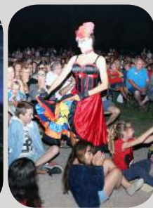
Spectacle "Un soir au cabaret"