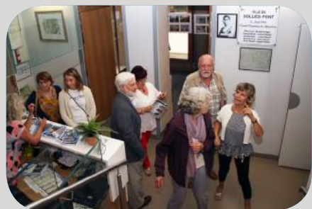
Le Château vous ouvre ses portes : Visite commentée du Château