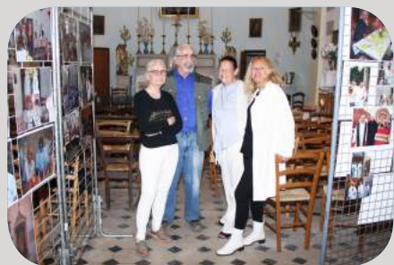
Visite de la chapelle Saint-Roch