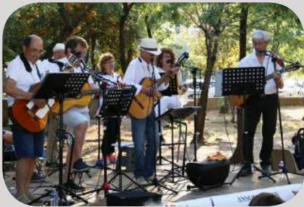
Concert par l'association "Allegria de Guitarra"