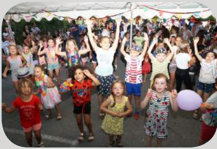
Boum pour les enfants