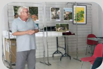
Conférence : La figue et les figuiers par "l'Écomusée de la Vallée du Gapeau"