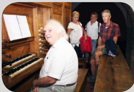
Église Saint-Jean Baptiste : Portes ouvertes de l'orgue de Callinet & exposition photos