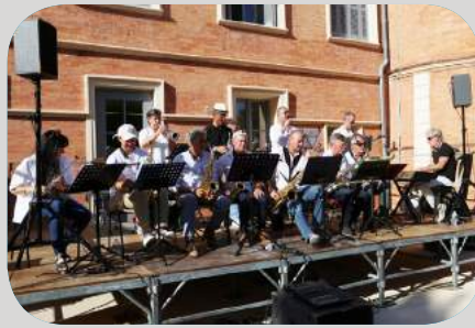
Atelier Jazz "Ecole de musique de la Vallée du Gapeau"