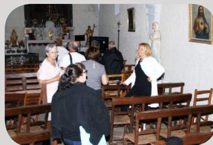
Visite de la chapelle Saint-Jacques