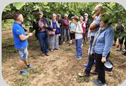
Balade dans les vergers de figuiers par "l'Écomusée de la Vallée du Gapeau"