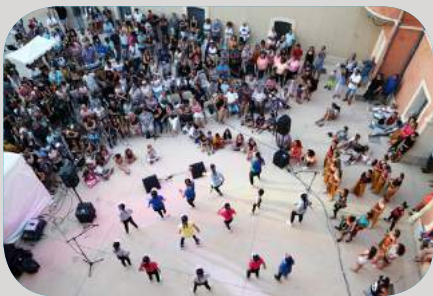
Atelier comédie musicale de Jean-Pierre & Sandry SAVELLI / Atelier zumba de Sandry