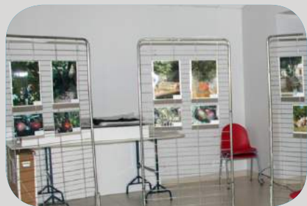
Exposition photos sur les différentes variétés de figes par "l'Écomusée de la Vallée du Gapeau"