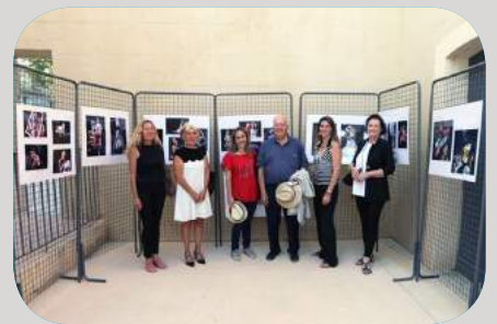
Exposition "MOD'ART" par les élèves des collèges "Lou Castellat" & "La Vallée du Gapeau"