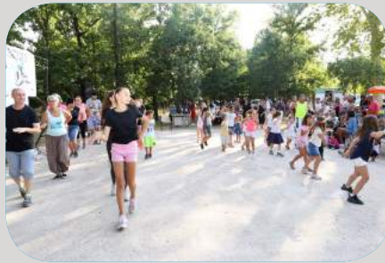
Danse latine, danse en ligne et zumba "Bailo Latina Boréal Innovation"