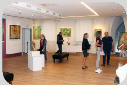
Exposition Mentor, D'un solliès à l'autre par "l'Office Culturel de Solliès-Pont"