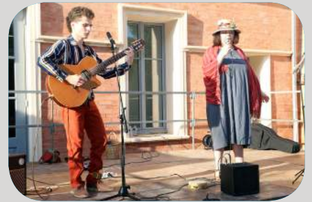
Concert du groupe "Woody Pantin Opéra Rock"