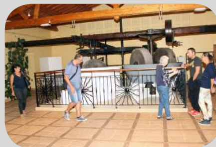
Visite de l'ancien moulin Gerfroit