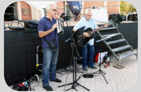
Tout en folk par l'association "Lei Ginesto"