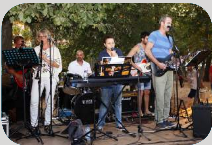
Concert du groupe "Cat's Roll"