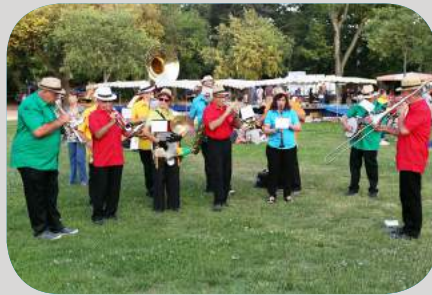
Déambulation musicale par l'association "Le Dixie au fil du Gapeau"