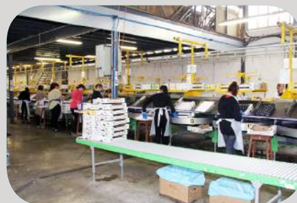
Visite de la copsofruit par "l'Écomusée de la Vallée du Gapeau"