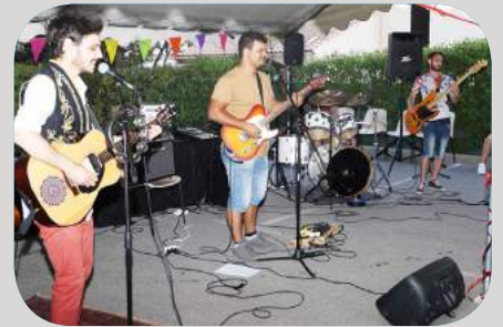
Concert du groupe "Natural Jam"