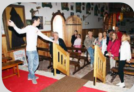
Visite de la chapelle Sainte-Christine