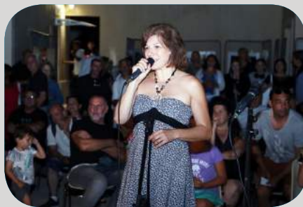
Karaoke Organisé par le service jeunesse