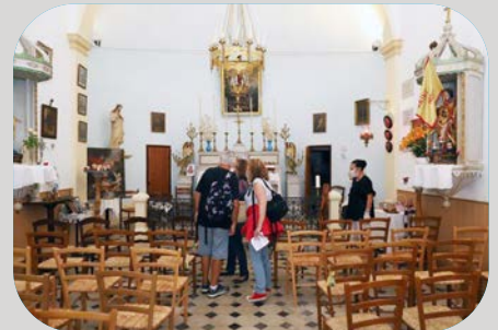
Visite des chapelles