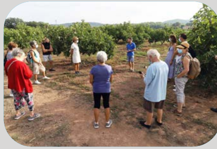
La figue de solliès, du verger à la coopérative...