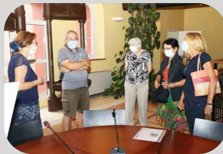
Visite de l'ancien moulin Gerfroit