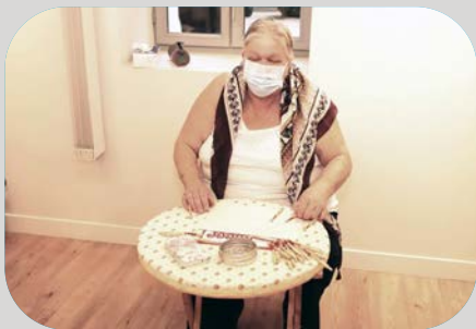
Exposition "Les dentellières"