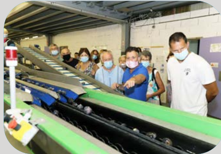
... La figue de solliès, du verger à la coopérative