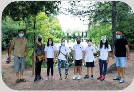
Balade botanique guidée