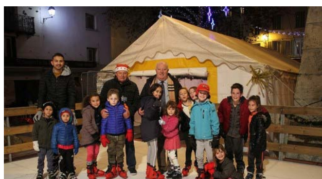
Soirée à la patinoire