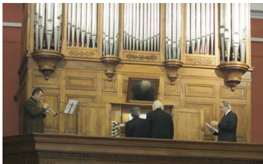
Association des amis de l'orgue de Callinet