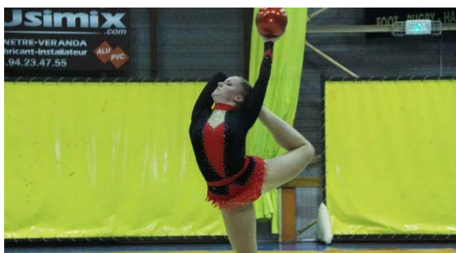
Spectacle de l'UGCS au gymnase