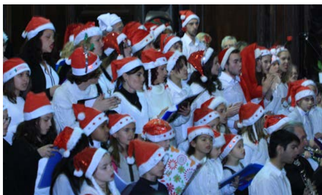
Chorale de l'école de musique