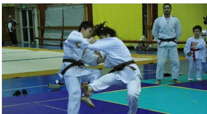
Démonstration de judo au gymnase