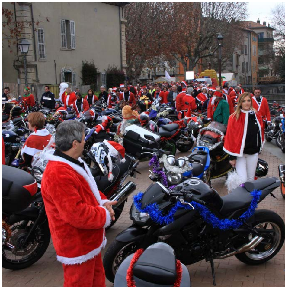
Défilé des pères Noël motards

Déjà les beaux jours arrivent, la ville en collaboration avec les associations proposent un programme encore bien chargé. Théâtre, concerts, festivals, séances de cinéma... vont animer la ville pour le plus grand plaisir des petits et des grands.