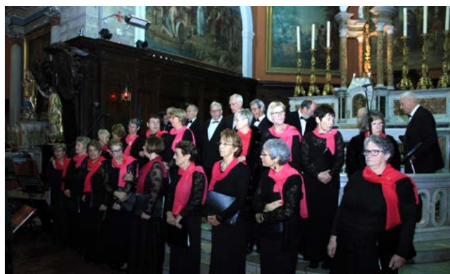
Ensemble vocal de Méounes