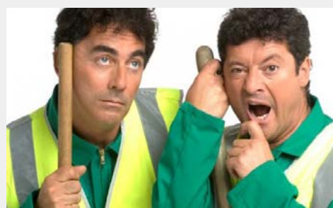
LES CHEVALIERS DU FIEL