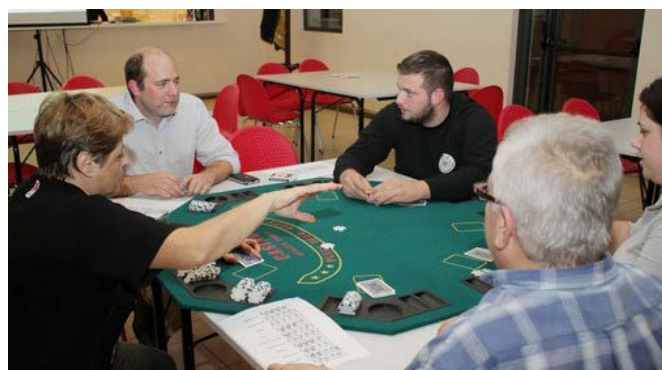
Tournoi de poker avec le club 210