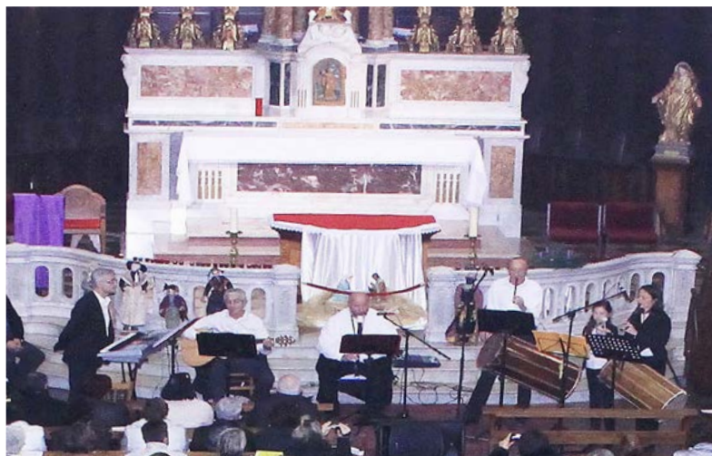
Association Lei Ginesto