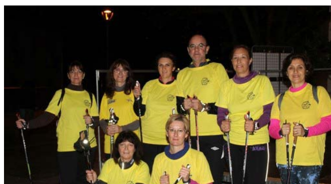
Marche nordique par l'AVAG