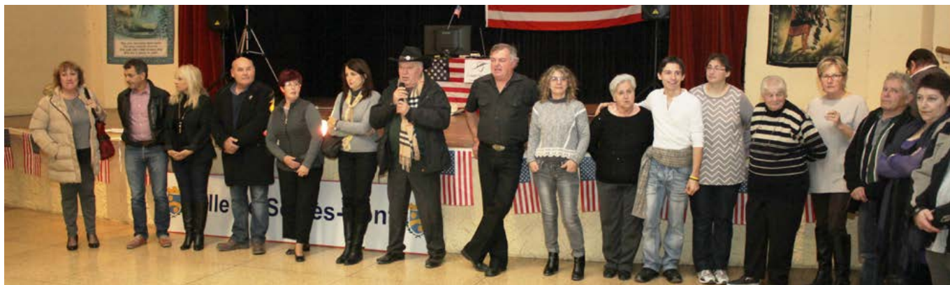
Ouverture du téléthon par monsieur le Maire et la country «Sun Valley»

Le téléthon a été organisé cette année sur 2 dates : vendredi 4 et vendredi 18 décembre. Il s'est déroulé un concours de boules, des démonstrations de country à la salle des fêtes et un tournoi de poker au foyer quiétude.