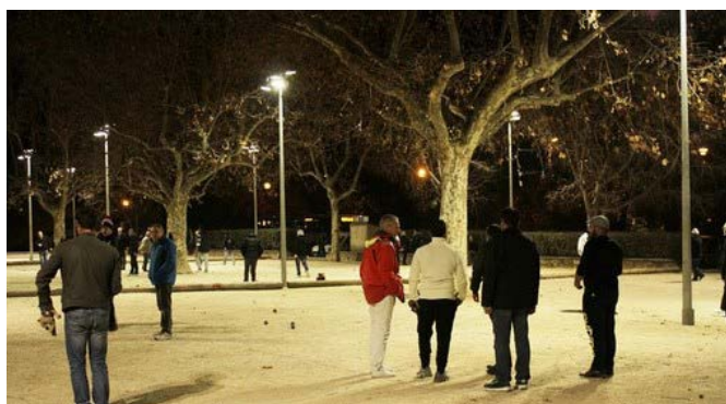
Concours de boules par la Solliésine