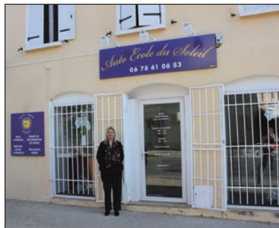
"Auto Ecole du Soleil" 117, rue de la République 06 78 61 06 53