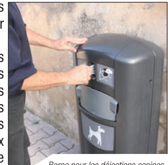
Borne pour les déjections canines

De même qu'elle exige des promoteurs immobiliers des places de stationnement liées au nombre de logements construits, la ville a entrepris la création de nombreux parkings et de places en zone bleue permettant de fluidifier le stationnement et d'améliorer la circulation en centre-ville.