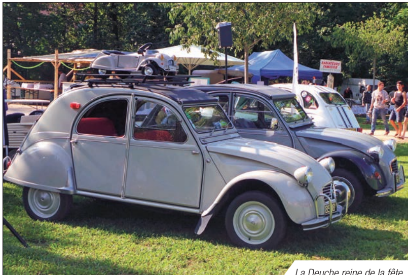
La Deuche reine de la fête

/// // // // // ■ Bourse Expo 2 cv // 4 - 5 octobre