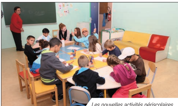
Les nouvelles activités périscolaires

La volonté est donc clairement affichée par la municipalité : assurer l'encadrement des activités par du personnel qualifié afin de garantir des conditions d'accueil et de sécurité optimale.