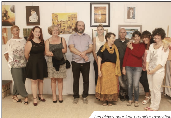
Les élèves pour leur première exposition

/// // // // // ■ Théâtre "Petit déjeuner compris" // 27 septembre