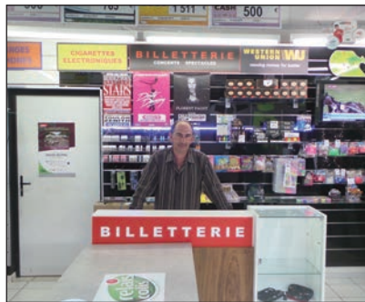
"Inter 421" Galerie Intermarché 04 94 12 76 72