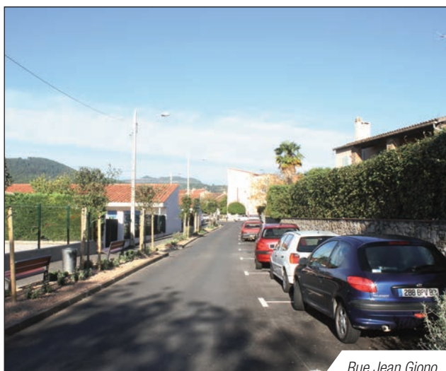
Rue Jean Giono