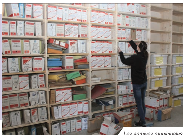
Les archives municipales