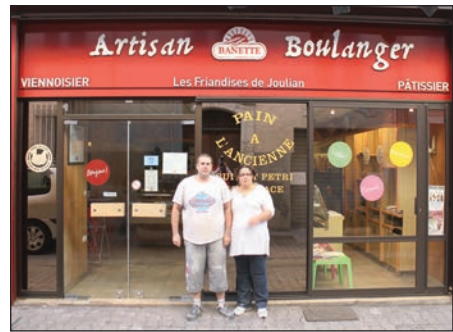
"Boulangerie Banette" 18, rue Notre-Dame 09 50 75 34 79