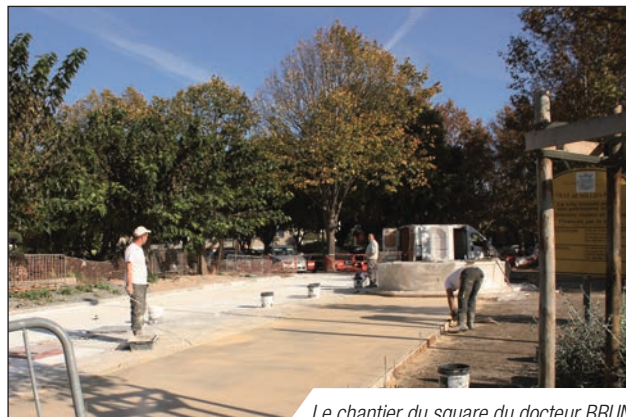
Le chantier du square du docteur BRUN