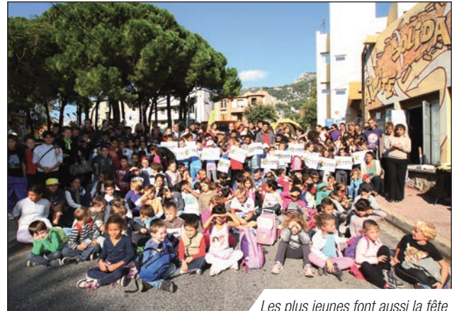
Les plus jeunes font aussi la fête