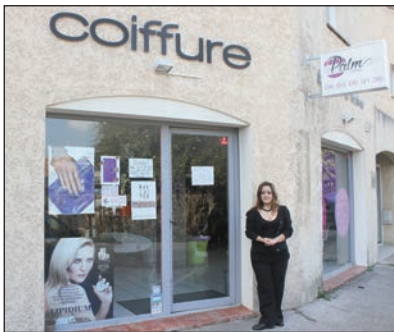
"Palm Coiffure" Le Liberté - Chemin de l'Enclos 04 89 66 91 36