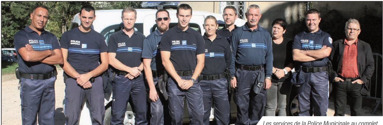
Les services de la Police Municipale au complet

C'est en sa qualité d'officier de police judiciaire, que le Maire a en charge sa police municipale dont on peut ainsi résumer les compétences : Assurer le bon ordre, la sécurité, la sureté, la salubrité et la tranquillité publique mais aussi la bonne application des arrêtés municipaux, le relevé des infractions routières et celles relevant du code de l'urbanisme. Notre police municipale Solliès-Pontoise répond bien évidemment à toutes ces fonctions avec un esprit de proximité et de contact avec la population.