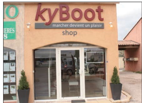
"KyBoot" B21, avenue du Lion - Espace Cadenet 04 94 48 29 25