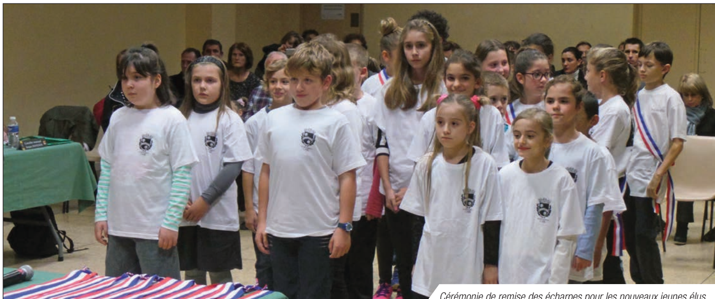
Cérémonie de remise des écharpes pour les nouveaux jeunes élus