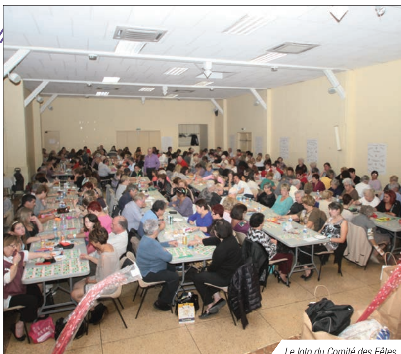
Le loto du Comité des Fêtes

Désormais, avec à la mise à disposition des locaux et du matériel, une fiche de contrôle sera éditée. Un agent municipal fera un état des lieux, afin d'en vérifier l'état, tant à la prise de possession qu'à la restitution.