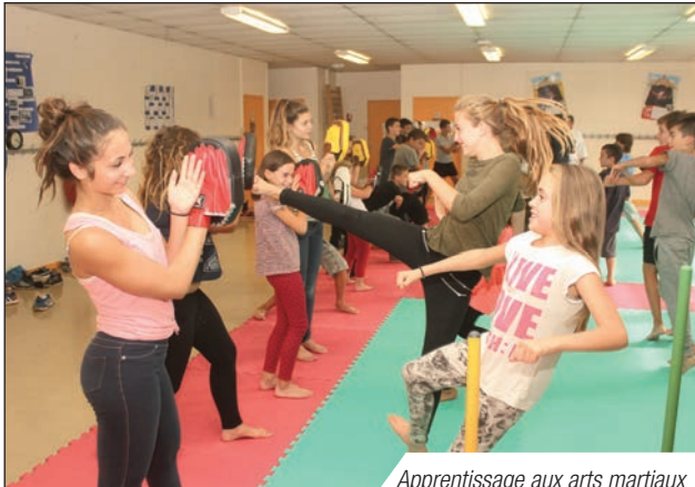
Apprentissage aux arts martiaux