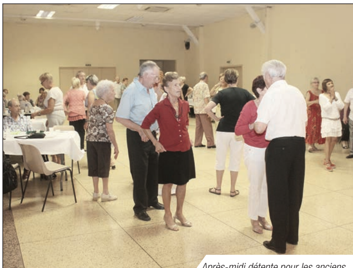
Après-midi détente pour les anciens