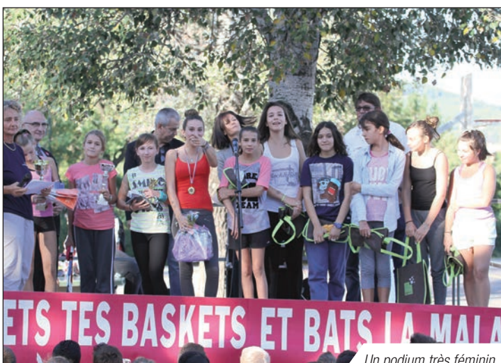
Un podium très féminin