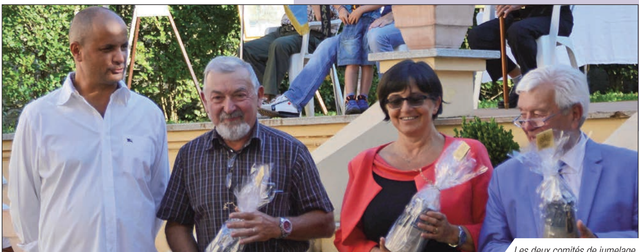
Les deux comités de jumelage

Repas, spectacles, conférences, défilés, recueillement devant le Monument aux Morts, surprises et divertissements en tous genres furent concoctés généreusement par la ville. Il faut ajouter qu'un soleil radieux a accompagné ces deux journées du 15 ème anniversaire. Au-delà de la fête, les deux comités ont pu de nouveau se projeter dans l'avenir afin de poursuivre ensemble cette formidable aventure humaine.