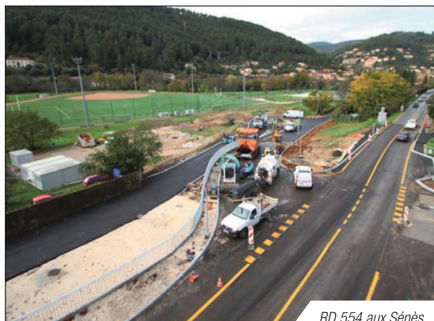
RD 554 aux Sénès