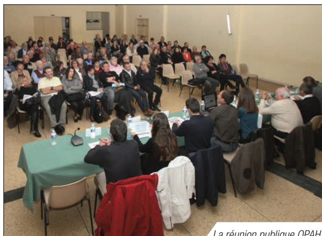
La réunion publique OPAH

Renseignement auprès de Priscilla Quipourt au : 04 94 13 82 52