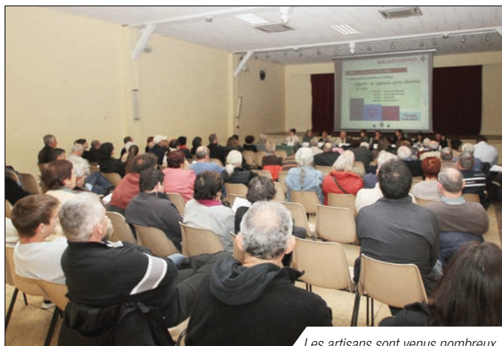
Les artisans sont venus nombreux