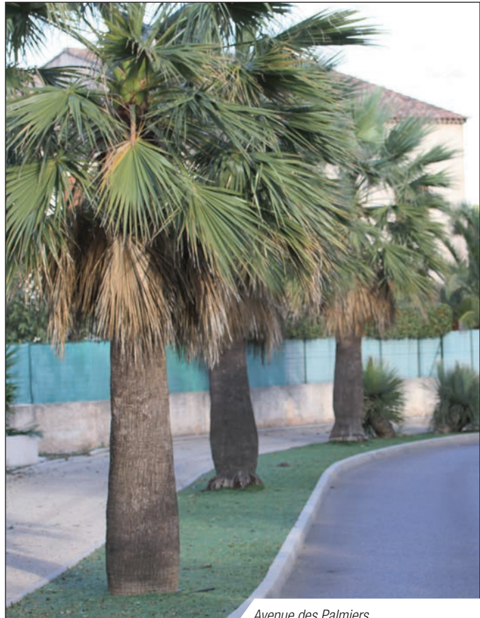
Avenue des Palmiers

Notre commune s'est attachée les compétences d'un expert pour analyser l'état sanitaire de nos plus gros spécimens, alors que l'ensemble des personnels sur le terrain reçoit une formation spécifique relative à la coupe des palmiers et à la protection des jeunes arbres réimplantés.