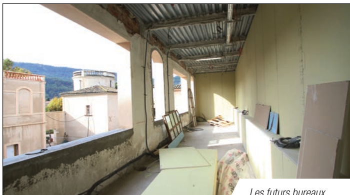
Les futurs bureaux

La mairie sera au château en 2015. En 2015, le château est à vous !