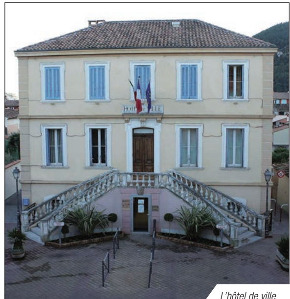
L'hôtel de ville