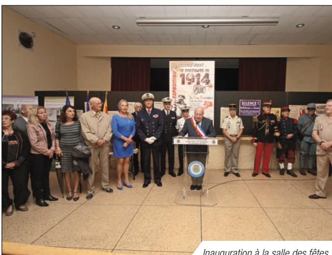
Inauguration à la salle des fêtes