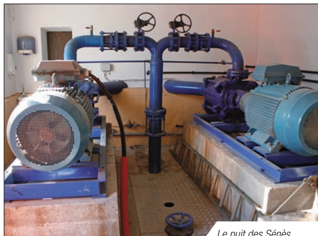
Le puit des Sènès

Il s'agit également d'imposer dans la zone de captage des eaux, diverses règles sur le bâti et l'utilisation des sols, ainsi que des mesures de sécurité sur la pollution. Le dossier finalisé débouchera sur un examen par les services de l'Etat avec la nomination d'un commissaire enquêteur et une enquête prévue pour le premier semestre 2015.