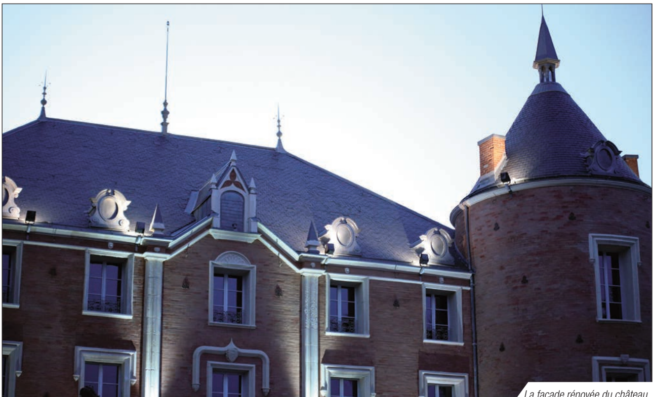
La façade rénovée du château

Les très importants travaux en cours devraient livrer en juin 2015 un ensemble administratif et culturel rassemblant de vastes et belles salles d'exposition et de conférences au rez de chaussée alors que les 2 étages accueilleront les services de la mairie qui quitteront la structure archaïque et peu fonctionnelle de l'avenue du 6 ème RTS.