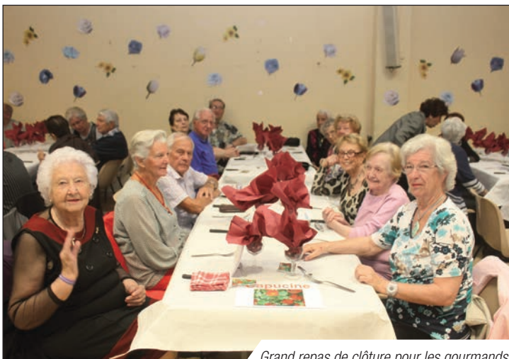
Grand repas de clôture pour les gourmands