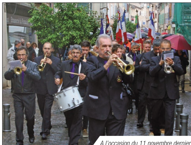
A l'occasion du 11 novembre dernier

La commune aménage actuellement des salles de cours insonorisées et un auditorium. L'équipe pédagogique est constituée de professeurs diplômés et d'un directeur technique. Les options proposées sont au nombre d'une dizaine autour des instruments à cordes, à vents, à percussions, ou claviers. Les inscriptions peuvent se faire tout au long de l'année. Les cours de solfège sont collectifs, par niveau et se déroulent le mardi entre 17 heures et 20 heures. Les élèves ont la possibilité de valider en fin d'année, leur niveau (instrument et solfège) devant un jury de la Fédération Française de Musique. Les professeurs animent des ateliers de musiques actuelles et de jazz. Des groupes de 3 à 7 élèves sont formés et se produisent à l'occasion des scènes ouvertes devant un public dans une ambiance familiale. Permanence le samedi de 9 heures à 13 heures (06 09 08 58 92).