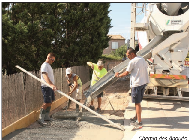
Chemin des Anduès