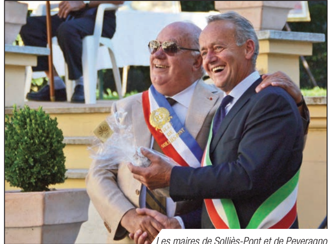
Les maires de Solliès-Pont et de Peveragno