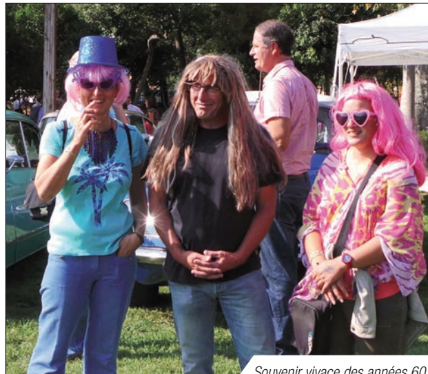
Souvenir vivace des années 60