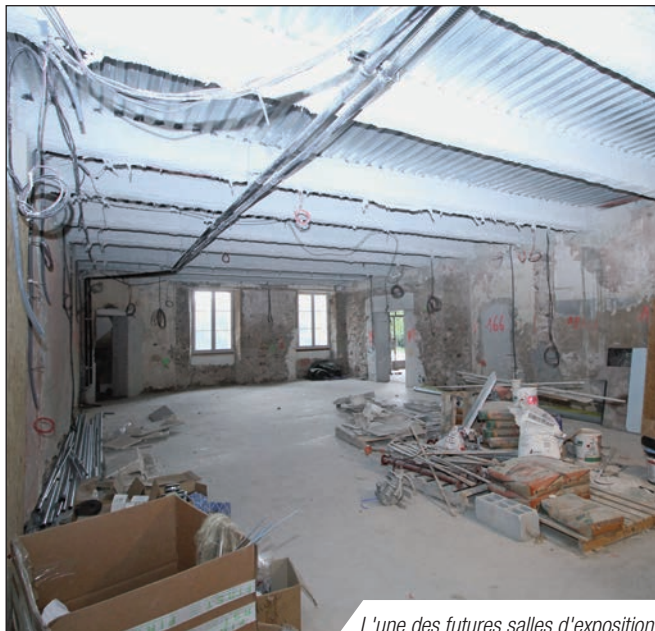
L'une des futures salles d'exposition

Au rez-de-chaussée, des extensions des ailes nord et sud ont été réalisées afin de recevoir les services d'accueil et les affaires générales ainsi que des espaces réservés au stockage et aux locaux techniques. Ces services voisineront avec