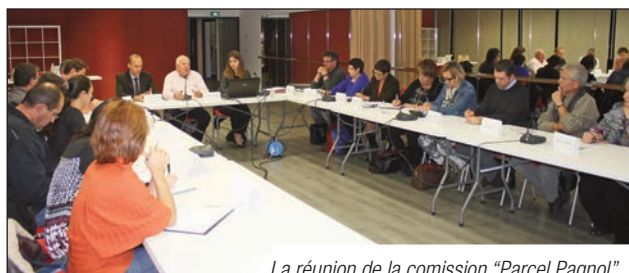
La réunion de la commission "Marcel Pagnol"