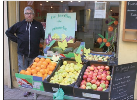
"Le jardin de Marie" Rue Gabriel Péri 06 59 42 68 39