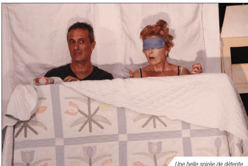
Une belle soirée de détente