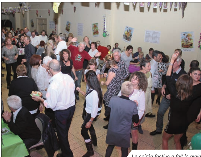
La soirée festive a fait le plein