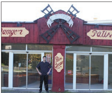
"Boulangerie - Pâtisserie" 23, avenue Général Magnan