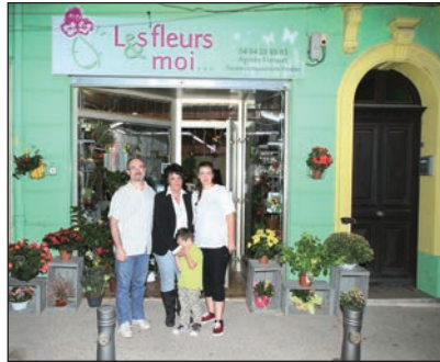
"Des fleurs et moi" 39, rue de la République 04 94 28 88 83