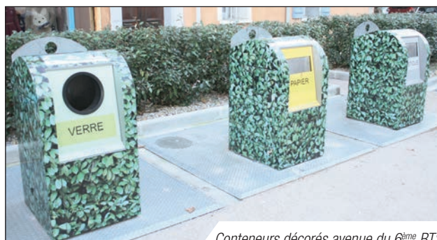
Conteneurs décorés avenue du 6 ème RTS

Il s'agit là d'une opération d'ensemble de requalification d'un axe de la commune devenu majeur après la mise en sens unique de la rue de la République. Ce chantier est constitué de plusieurs phases dont la première a déjà été réalisée avec la réfection du parking du boulo-drome, l'acquisition de la propriété Mandon, sa rénovation dans le but d'accueillir le Secours Populaire et Gapeau FM ainsi que la création d'un nouvel espace associatif, la maison Yvonne et Jean Murat.