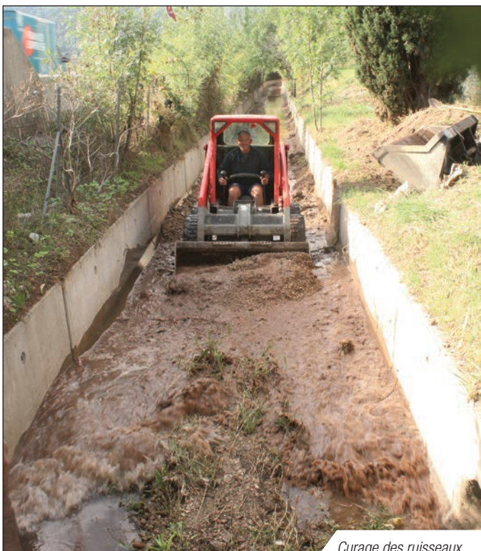
Curage des ruisseaux

L'étude préconise le recalibrage de ces ruisseaux et la création de bassins de rétention permettant de stocker temporairement le surplus d'eau de ruissellement. L'ensemble va permettre de supprimer les débordements notamment vers les habitations en amont de l'A57, sur la RD 58, sur le chemin des Laugiers, sur le chemin de Sauvebonne et au droit des zones urbanisées en aval du chemin de la Diligence.