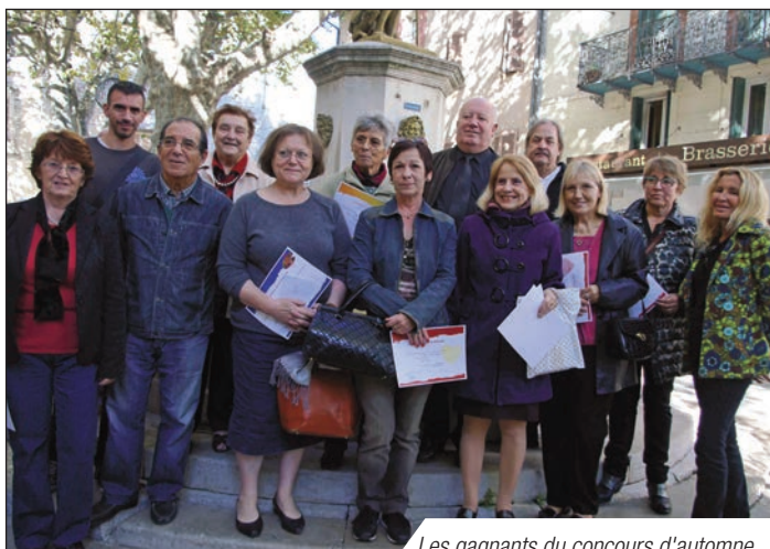
Les gagnants du concours d'automne