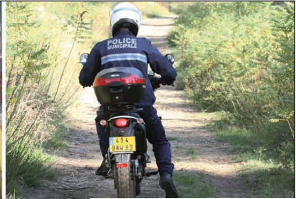
Les services de la Police Municipale en action