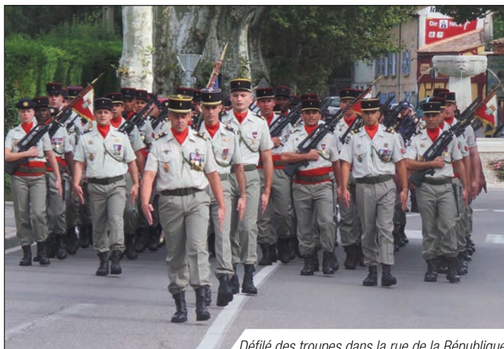
Défilé des troupes dans la rue de la République