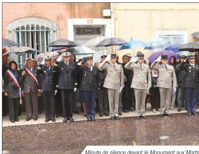
Minute de silence devant le Monument aux Morts