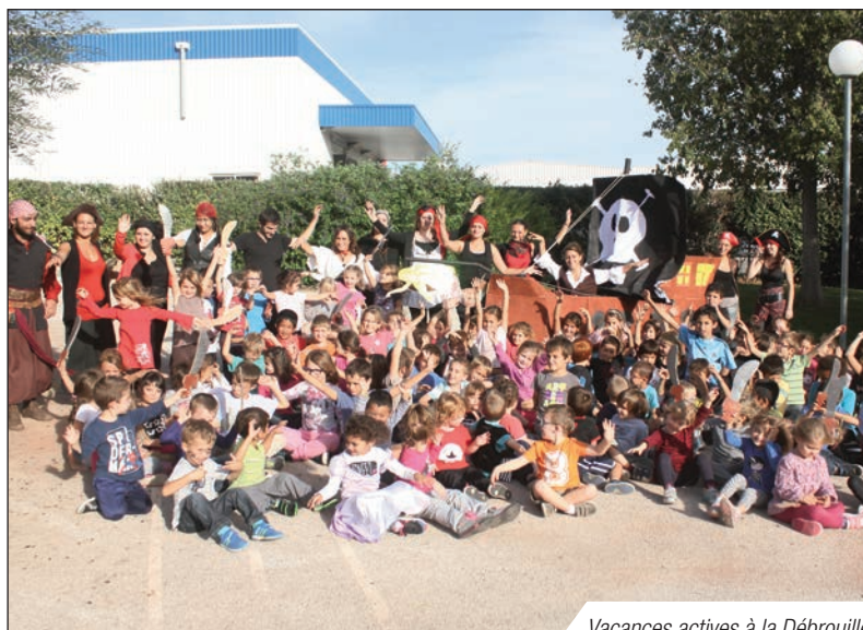
Vacances actives à la Débrouille