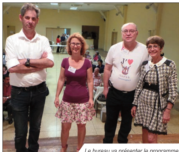
Le bureau va présenter le programme

/// // // // // ■ Bourse Expo 2 cv // 4 - 5 octobre