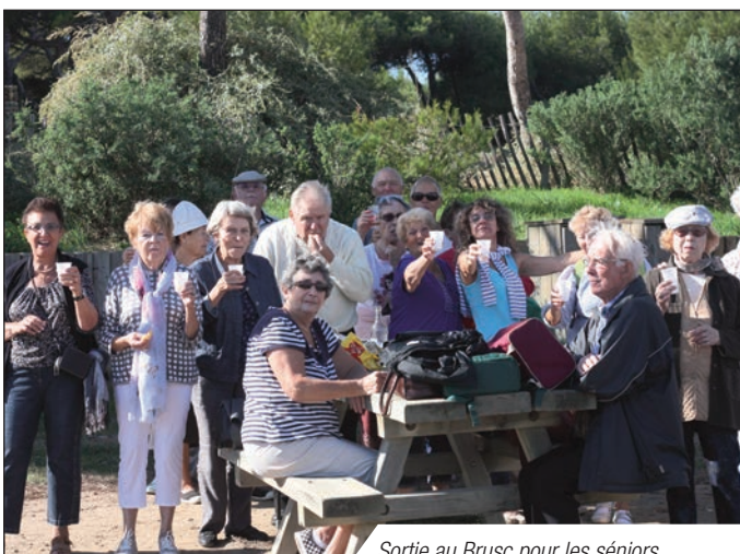
Sortie au Brusç pour les séniors