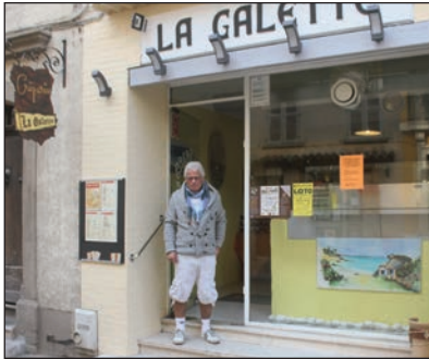
Crêperie "La Galette" 46, rue de la République 04 94 31 43 13