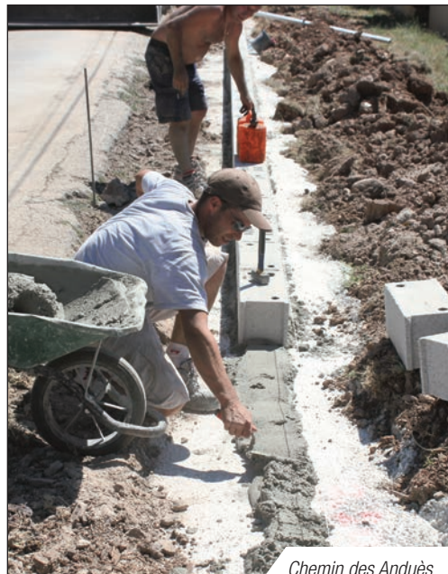
Chemin des Anduès

• Avec la CCVG, le réseau pluvial des avenues du Lion et de l'Arlésienne a été requalifié avec l'élargissement d'un piétonnier pour l'accès à la ZAC de la Poulasse et la mise en accessibilité des voiries pour les personnes à mobilité réduite.