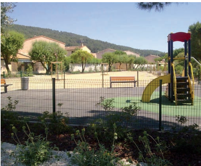
Sainte-Christine : le nouveau square de La Peirouard