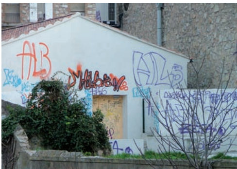
Des actes d'incivisme qui coûtent cher au budget de la commune

Évitez à la collectivité une gêne et des dépenses inutiles ! La propreté de nos rues est l'affaire de chacun !