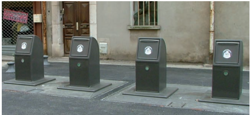
De nouveaux conteneurs enterrés ont fait leur apparition rue du 6 ème RTS, et ce n'est qu'un début !

Cela représente un effort important de la commune : 145 000 euros pour la première tranche de travaux. Les prochains sites concerneront l'avenue Jean Moulin, la rue Jean Giono, la rue Pierre Curie, l'avenue des Palmiers, et l'avenue Sainte-Claire Deville.