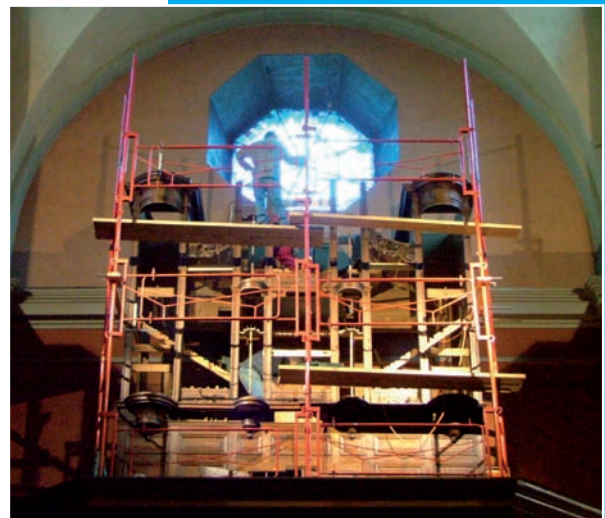
Église Saint-Jean Baptiste : réfection de l'orgue Callinet