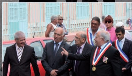
et des personnalités à l'unisson ...