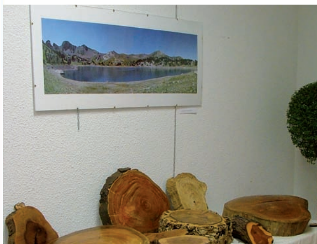
Bois et photos : quand la Nature se plaît à imiter l'art (exposition P. Villa et L. Joulian)