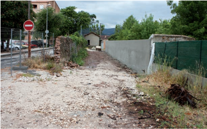
La création de la nouvelle avenue des Palmiers est en bonne voie