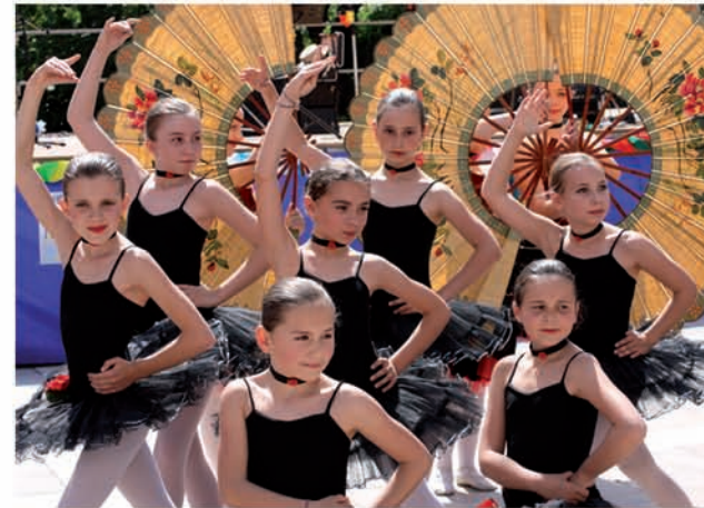
Les jeunes élèves du Centre Terspichore dans une interprétation colorée de Carmen