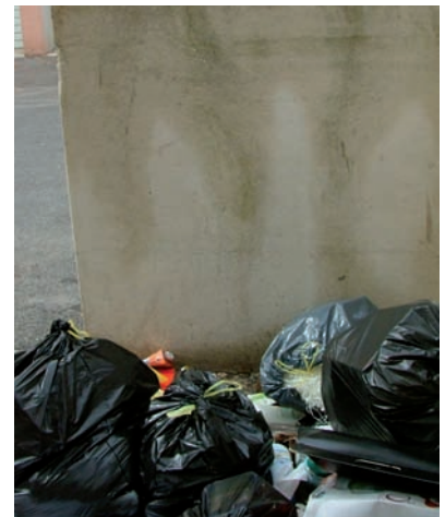
Un spectacle désolant que l'on ne veut plus voir

Les dépôts sauvages ont un coût supplémentaire pour la commune : le conseil municipal du 28 mai 2009 a décidé, à l'unanimité, de le répercuter sur les pollueurs.